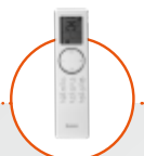
Afstandsbediening infrarood CLIVIA (wit) YBE1F