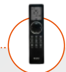
Afstandsbediening infrarood CLIVIA (zwart) YBE1FB2